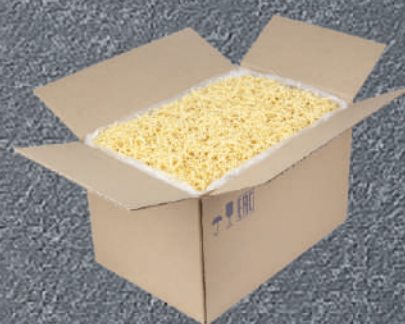
ЛАПША ЯИЧНАЯ «ДЛЯ СУПА И ГАРНИРА»/ «ДОМАШНЯЯ»/«ЛАГМАННАЯ»

Состав: мука из твердой пшеницы для макаронных изделий высшего сорта, вода питьевая, продукты яичные.