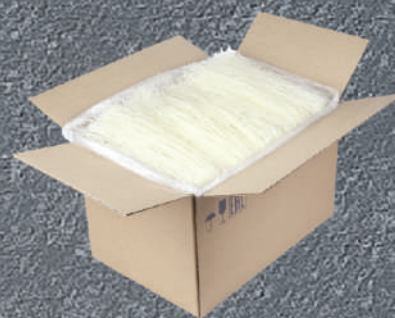
ЛАПША КРАХМАЛЬНАЯ БОБОВАЯ «ФУНЧОЗА»