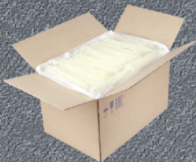
ЛАПША КРАХМАЛЬНАЯ «ФУНЧОЗА»

Адрес: 644018, Россия, Омская область, г. Омск, ул. 5-я Кордная, д. 65/Д, корпус 4. Тел. +7(3812) 499-651