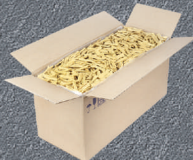
СПАРЖА СОЕВАЯ СУХАЯ TM «RUS ASIA»

Состав: соевые бобы, питьевая вода, соль пищевая.